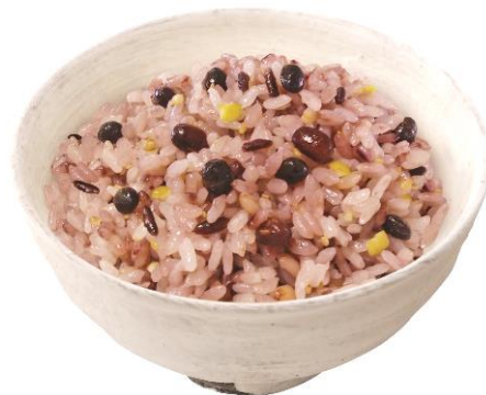
新商品「薫り立つ雑穀米」